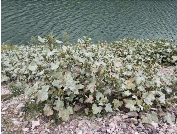
河堤绿化措施 (2020年6月)