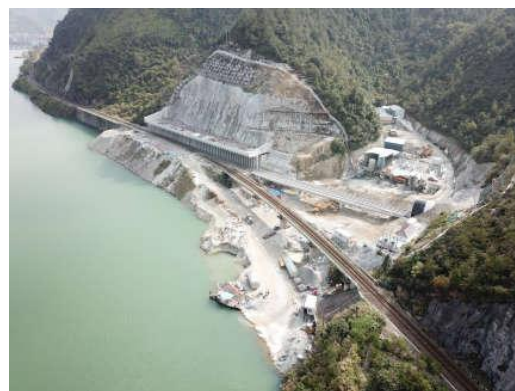
工程整体情况 (2020年3月)