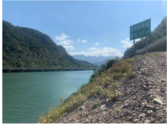
河岸边坡复绿 (2020年6月)