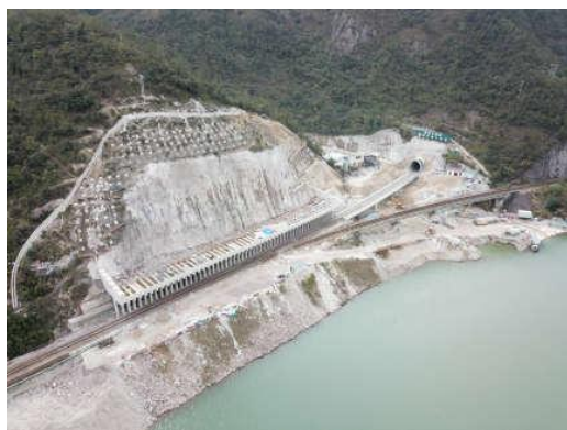
工程整体情况 (2020年3月)